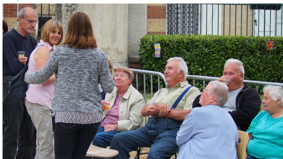
Les fêtes communales sont des moments importants, car propices aux échanges, aux rencontres et aux retrouvailles heureuses. La magie de ces instants est lisible dans les regards.