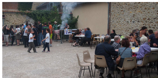
La température clémente, permet une restauration de plein air, soit en groupe attablé ou barquette à la main en se promenant dans le parc.