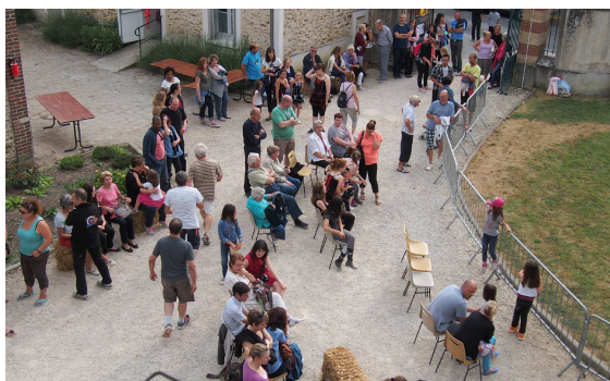
17h30, le beau temps est au rendez-vous, le parc de la mairie commence à se remplir et l'ambiance à s'installer; le spectacle peut commencer.