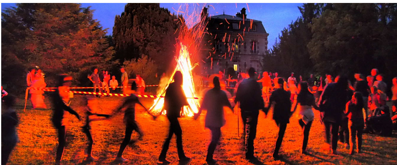
Le feu est allumé, Didier, Pascal et Meriem gèrent la musique. Autour du brasier, main dans la main, une ronde se forme pour fêter l'arrivée de l'été et les vacances qui approchent.