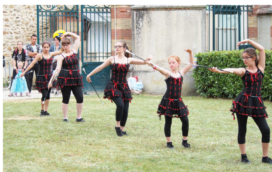
Les majorettes de Fontenailles, associant la danse à la musique, ont présenté trois chorégraphies pétillantes et parfaitement rythmées. Un grand bravo à elles.