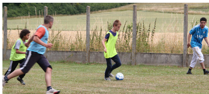
Les quatre équipes se sont affrontées sous l'oeil vigilant de l'arbitre Momo.