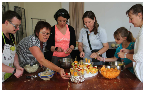
Plus de trois cents brochettes savoureuses et colorées sont confectionnées dans la bonne humeur pour assurer l'apéritif de la fête fontenailloise.