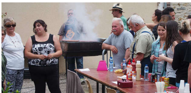
Sur le parking de la mairie, un fumet de barbecue attire les visiteurs. C'est l'association Familles Rurales qui propose merguez et saucisses-frites. Merci aux membres de l'association.