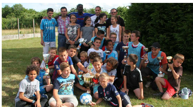
Des mains des filles du CMJ, les vainqueurs ont reçu leur coupe. Un moment de bonheur et de fierté partagé avec les parents clôture ce week-end festif à Fontenailles.