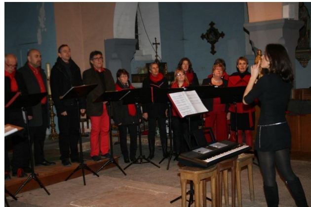
LA CHORALE, LES CHANTS DU VOYAGE