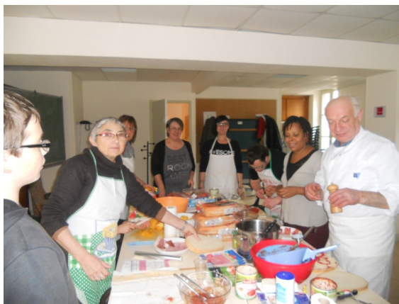
LES CUISINIERS EN ACTION