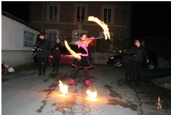
UNE DÉMONSTRATION DES ÉTOILES DE FONTENAILLES