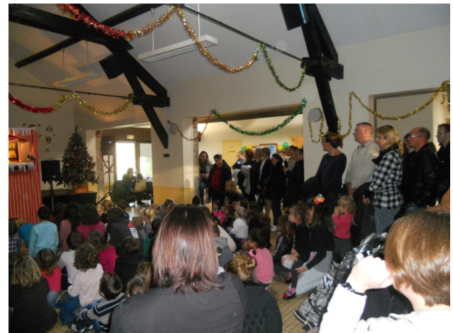
LE PÈRE NOËL