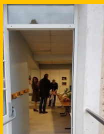
18h00, l'arrivée des premiers clients