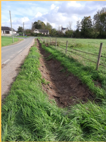
Rue du Commandant Chesnot