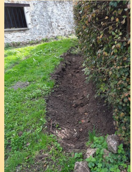
Le lavoir du Bezard