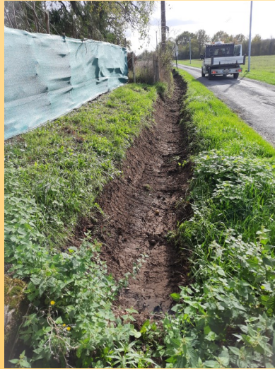
Route de la Charmée