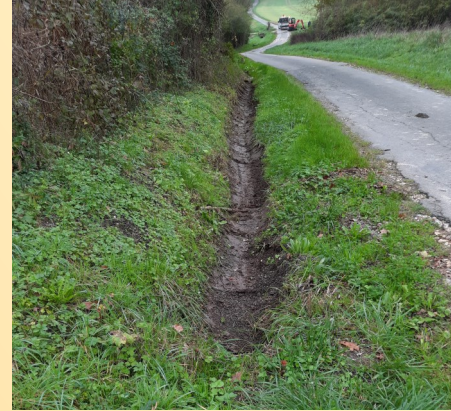
Route de Pars